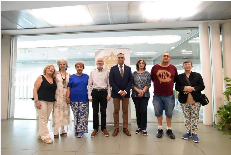
Diputación con las Asociaciones Granadinas de Salud Mental