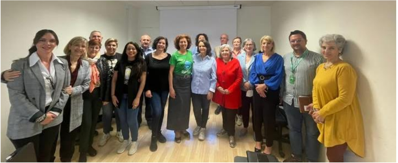
Reunión Centro De Salud Gran Capitán