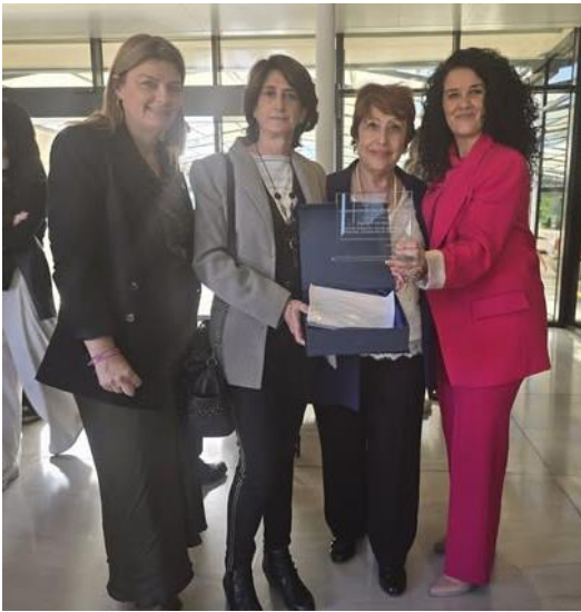
Día Mundial Parkinson