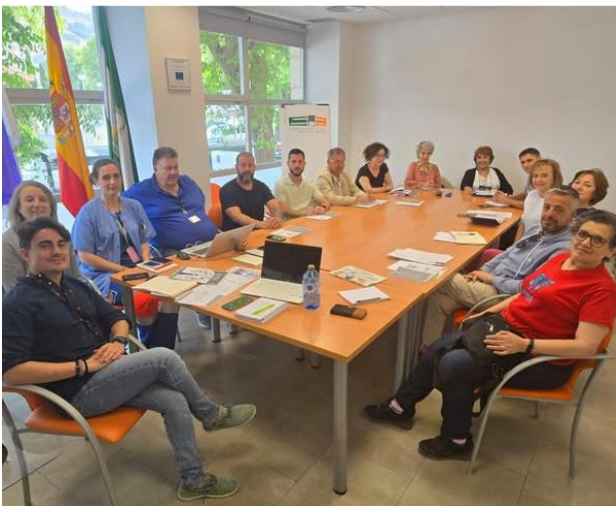
GRANABIP colabora en el Hospital de Loja