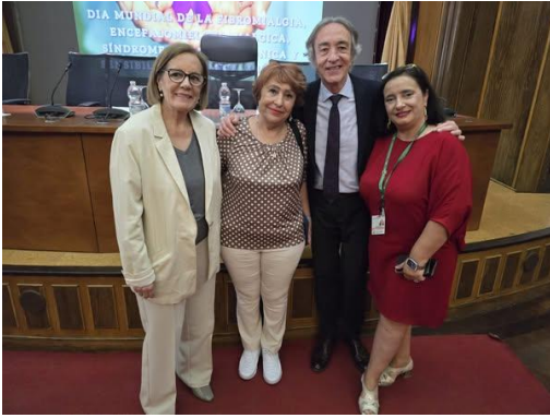
Día Mundial Fibromialgia